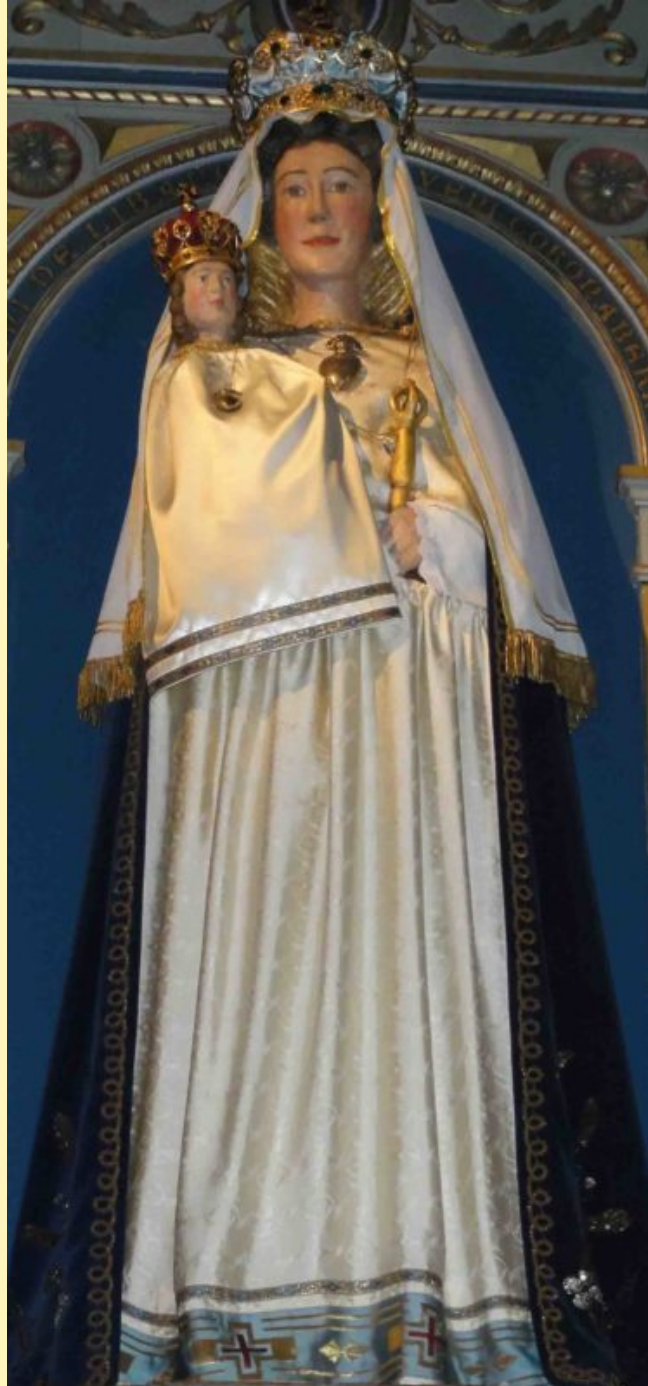
Notre-Dame de Rumengol "Intron Varia remed oll" "Notre-Dame de Tout Remède"

Et pour les époux et pères de famille ! pèlerinage le 30 juin, 1er et 2 juillet 2023 Infos : peleperes29@gmail.com